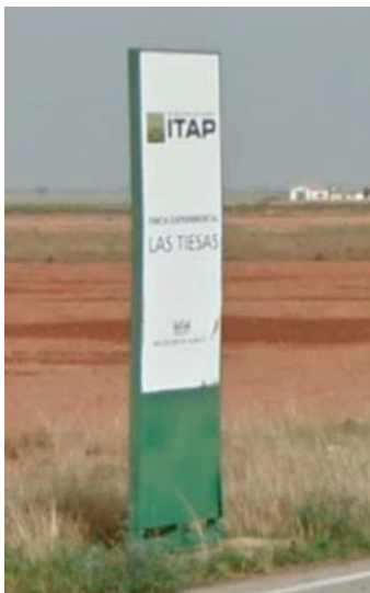
Cartel indicador en el Cruce.

Zonas de aparcamiento y acceso al campo de tiro.